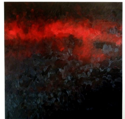
Dieter Ditscheid (dede)