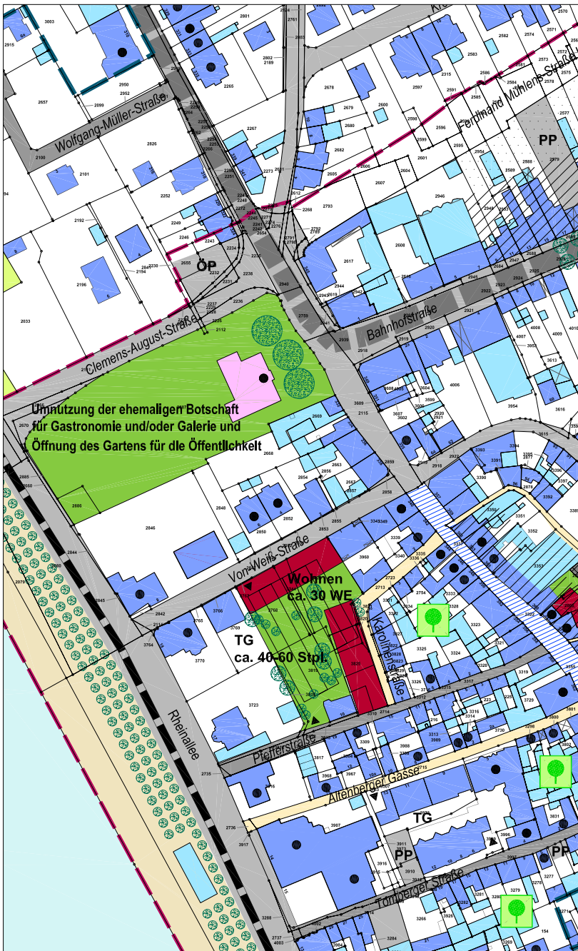
Ehemalige Botschaft - Krämer's Laden