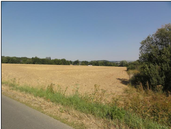
Abb. 4: Getreideacker mit Böschung und angrenzendem Uferstreifen

Trauben-Holunder ( Sambucus racemosa ) aufweist.