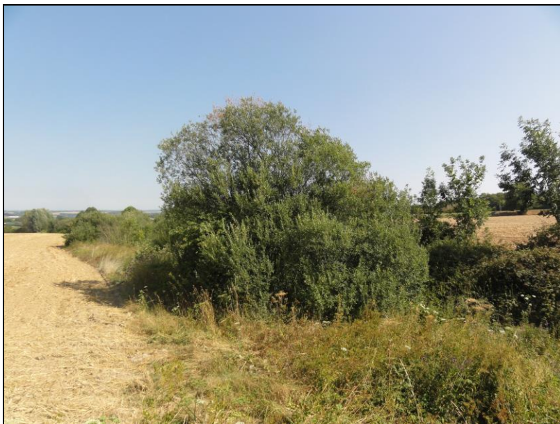
Abb. 3 Ackerfläche mit angrenzendem Elsterbach

Oberflächengewässer kommen innerhalb des Plangebiets nicht vor. Parallel zur östlichen Plangebietsgrenze fließt der Elsterbach unmittelbar angrenzend an das Plangebiet als nicht berichtspflichtiges Gewässer. Das Fließgewässer wird von Gehölzen und naturnahen Uferstrukturen begleitet. Der Elsterbach mündet unmittelbar an der BAB A 3 mit dem Rottbach in den Döttscheider Bach. In das Fließgewässer wird nicht eingegriffen.